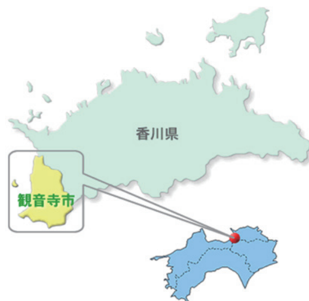
図1 観音寺市の位置

『時は神世紀300年。中学2年生の結城友奈は、ある日、所属する勇者部の仲間とともに、世界すべてが樹木へと