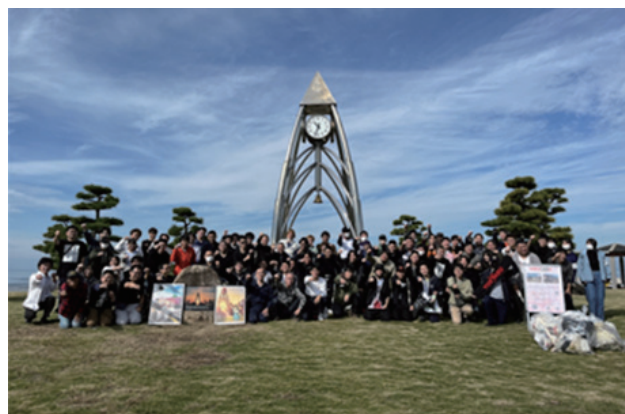
図 3 活動終了後の写真撮影