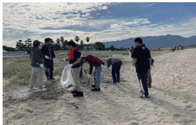
図 2 ゴミ拾い中の参加者の様子

者の推移を示している。参加者の数値は過去のデータとの整合性によりアンケート回答データから抽出しており実際の参加者数とは異なる。参加者数には、プロジェクトを実施する側の人数は含まれておらず、地域住民は含まれている。先述したように、第 5 回「リアル勇者部」からは前後の日程で同作品に関連するイベントとの抱き合わせ開催としている。これにより「リアル勇者部」のために来県してもらうのではなく、イベント参加のついでに「リアル勇者部」に参加してもらえようになり参加者が急増した。第 7 回は瀬戸内国際芸術祭に抱き合わせで開催したが、同日に横浜で大型のアニメ同人誌即売会が開催されており参加者数は少数であった。しかし、「リアル勇者部」の参加者に限定しないフォトコンテストでは、111 件の伊吹島の写真が寄せられた。2020 年、2021 年はコロナ禍ということもあり香川大学・観音寺市・株式会社ポニーキャニオンの三者で協議の上で開催を見送った。2022 年の第 8 回以降はこれまでと同様に「リアル勇者部」の前後にイベントがある日程で開催した。第 10 回に関しては同日の午後からイベントが開催されることから、午前中に「リアル勇者部」を開催した。第 10 回の開催は、午後からのイベントの物品販売が「リアル勇者部」と同時刻で行われており、参加を諦めたという声が X (旧 Twitter) で見られた。人数の変動はあるが、中四国の近隣県だけでなく、全国各地から「リアル勇者